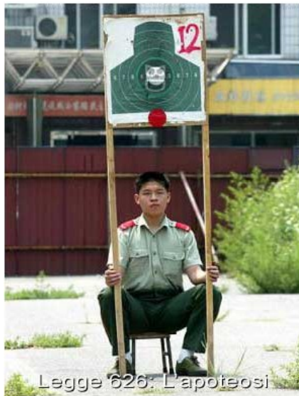
Legge 626: L'apoteosi

Resta completamente confermato l'impianto generale della 626 che modifica le organizzazioni del lavoro definendo nuovi ruoli e più precise responsabilità per un nuovo approccio ai problemi della sicurezza sul lavoro.