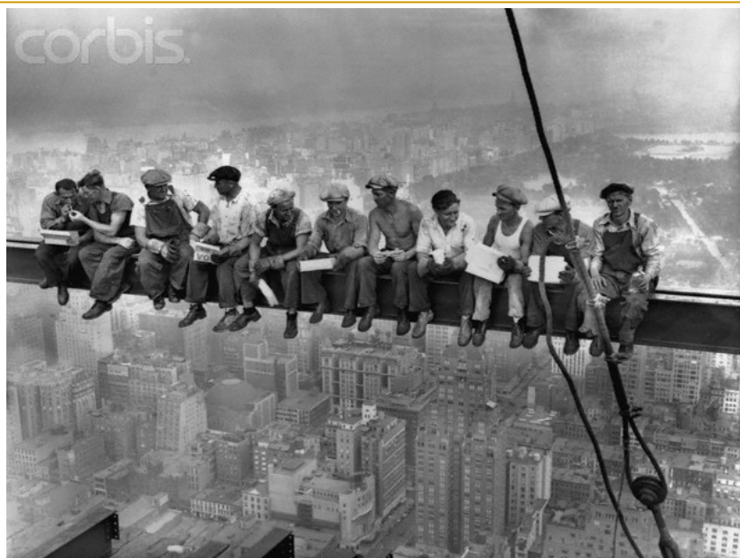
Charles C. Ebbets - Pausa sul Rockefeller Center, 1932 (Lunch Atop a Skyscraper – Pranzo in cima ad un grattacielo – 244 m di altezza- 69° piano)